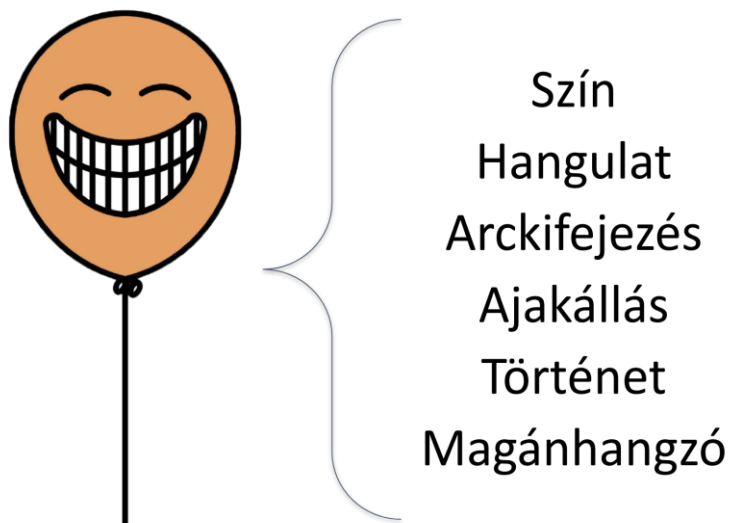
1. illusztráció: a Mesezene szimbólumai komplex asszociációs rendszerben segítik rögzíteni a vizuális jelek és a beszédhangok közötti kapcsolatot

Az óvodai modul a beszédhangokat szimbólumokhoz (lufik, játékok) kapcsolja. Az asszociációs rendszer meséken keresztül épül ki, melyek egy egész nevelési éven ívelnek át. A történeti kontextus, illetve a megfelelő mennyiségű idő rendkívül fontos ahhoz, hogy a tudás elmélyülhessen. A gyorsan, felszínesen, kapaszkodók nélkül megszerzett információ pillanatok alatt halványodik el. A kapcsolatrendszer a fonológiai és a printtudatosságot egyszerre fejleszti. Mivel a gyermek beszédhangokat keres, "hall ki" szavakból, így hozzájárul a fonológiai tudásához, s mivel ezeket vizuális jelekhez köti, így a beszéd és írott nyelv közötti kapcsolódás elemi tudása is kiépül benne.