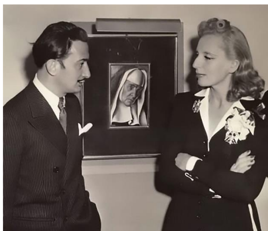
1. fotó: Tamara de Lempicka with Salvador Dali in New York, 1941 Készítette: Nicholas W. Orloff. Forrás: The Moscow Times, 2024, online

Az alábbiakban szeretném bemutatni az olvasónak Tamara de Lempicka gazdag életútját. Számos forrásanyag, amit áttekintettem, egyoldalú narrációnak bizonyult, élete, személyisége érezhetően ingerelte és mai napig ingereli a hagyományosan, illetve férfi központúan gondolkodó embereket, férfiakat és nőket egyaránt. Csak az utóbbi években kezdtek, elsősorban női riporterek, színészek, popsztárok, filmkészítők, más szemszögből is értékelni őt. A „szuperasztár” jelzőt Fenyvesi Zsófi újságíró tollából vettem át (Fenyvesi, 2019).