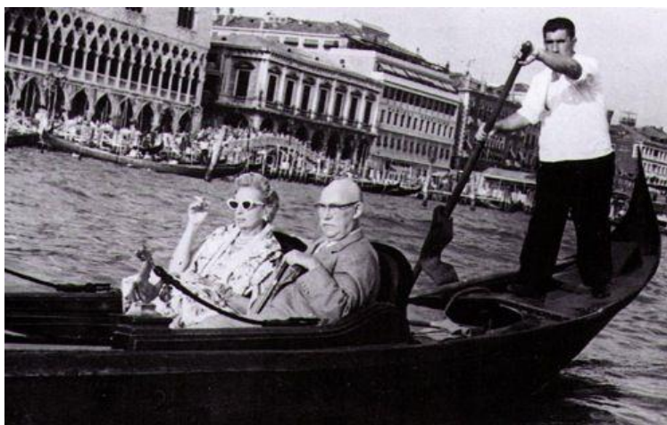
6. fotó: Tamara de Lempicka és Raoul Kuffner báró, Velence, 1950 körül

1940-ben a náci Németország lerohanta Párizst. Tamara lánya és a báró két gyermeke akkor még Franciaországban tartózkodtak. A szülők telefonos utasítására a gyerekeket egy nappal a németek bevonulása előtt vonatra tették és hamis papírokkal, együtt nekivágtak az útnak, azonban a határon feltartóztatták őket. Végül Eleanor Roosevelttel közbenjárásával és védelme alatt jutottak el az USA-ba. Tamarának és férjének rengeteg kapcsolata volt, az ajtók megnyíltak előttük.