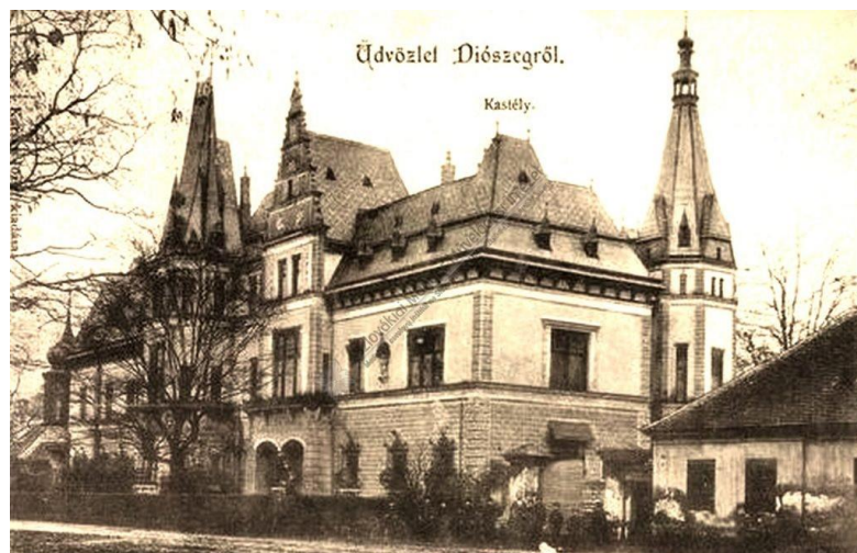
5. fotó: Kuffner Kastély, Diószeg, 1910 körül

Készítette: Karsay József. Forrás: Szlovákiai Magyar Művelődési Intézet, 2024, online