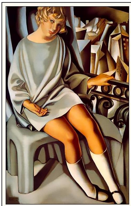
2. fotó: Tamara de Lempicka: Kizette on the balcony , 1927