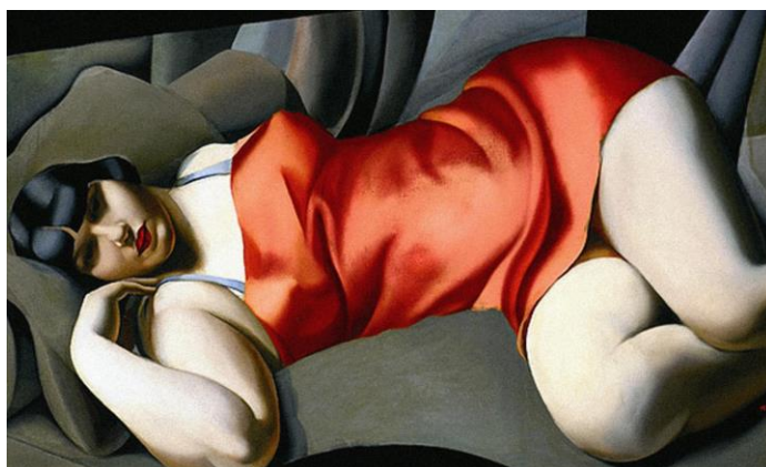
3. fotó: Tamara de Lempicka: Woman in Red, c. 1933