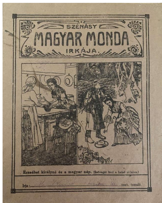
1. kép: Szénásy Magyar monda irkája 1901-ből (Erzsébet királyné és a magyar nép)

A gyerekek legegyszerűbb füzetének címlapján is helyet kapott a királyné. Az ún. Erzsébet-irkát Erzsébet királyné arcképe és Flóris Áron költeménye díszítette, a hátlapján pedig a hazai ipar pártolásáról írtak. Több ilyen füzet is készült további hasznos témával a hátlapján, például a pálinka pusztításáról, az Erzsébet emlék-gyümölcsfák ültetésének hasznáról, a kivándorlás veszedelméről, a fogak gondozásáról, a tüdővész elkerüléséről, az otthontanulásról, a tüzvész meggátlásáról, a mérgezéseknél az első segélynyújtásról, a méh, selyemhernyó, baromfi, kerti vetemények tenyésztéséről, illetve termesztéséről (Flóris, 1903). Egy másik füzet-sorozat, az ún. Szénásy Magyar monda irkája vöröses barna papíron a magyar mondakörből történeti képekkel díszítette a címlapot, a második oldalon pedig annak történetét. Ezek között is találtunk Erzsébet királynét bemutató irkát, a címlapon két jelenettel, Erzsébetet a jótékony királyné szerepben ábrázolva (1.kép), és a történetet aztán a belső oldalon elmesélve. Ez a második füzet-sorozat küllemében és tartalmában is több kritikát kapott a kortársaktól (Hemmert, 1901).