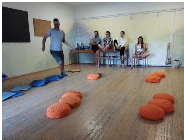
3. ábra: Játék selyemmel (a szerző felvétele, 2023)

A második réteget a játékok során felmerülő érzések és érzelmek alkotják, amelyek hozzáférést biztosítanak a bennünk rejlő bölcsességhez. A fokozatos gyakorlással, az átélt öröm mellett, kapcsolatba kerülünk saját blokkjainkkal és mindenféle dologgal, ami megakadályozza, hogy úgy cselekedjünk és viselkedjünk az életünkben, ahogyan szeretnénk. Ahhoz, hogy feloldjuk ezeket a blokkokat, új szinapszisokat kell létrehozunk, hogy legyőzzük a régi reflexeket. Ez lehetséges, de szabad akaratot és kitaró gyakorlást igényel. Az intuíció itt azt jelenti, hogy nincs ellentmondás a gondolkodásunk és a cselekedeteink között, és hogy egy adott cselekvés vagy reakció pontosan annak felel meg, ami az adott pillanatban a legésszerűbb. Mindkettő tudatosan történik.