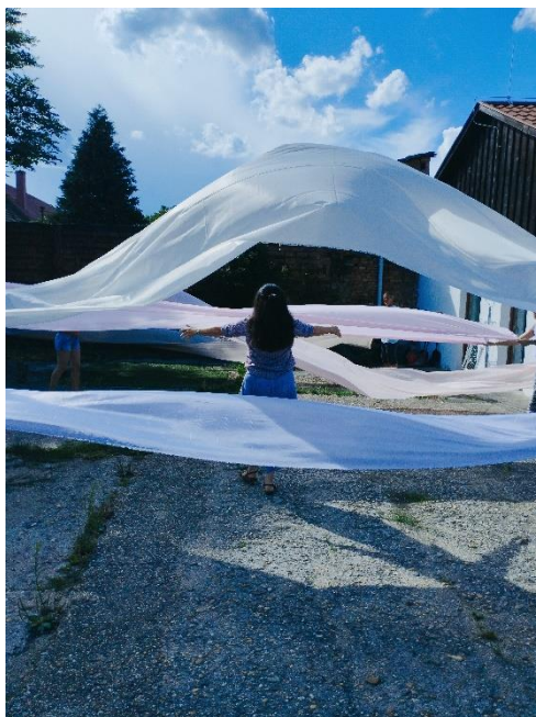
2. ábra: Játék selyemmel