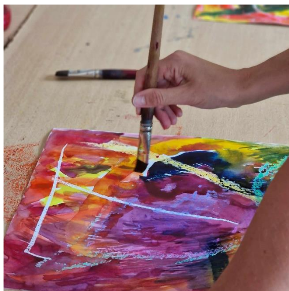
4. ábra: Intuitív festés

A Pár Play -gyakorlatok közül sok olyan tapasztalatot nyújt, ami elsőre lehetetlennek tűnik. Képzeljünk el egy gyakorlatot két emberrel. Az egyik áll egy botot a kezében, a másik előtte áll, háttal neki, majd lassan előre sétál. Egy bizonyos idő után az álló személy a botot a sétáló személy hátába dobja. Utóbbinak az a feladata, hogy észrevegye, amikor a botot hátulról dobják, megforduljon és elkapja a botot. Ebben a gyakorlatban felfedeztük, hogy pontosan meg lehet különböztetni, hogy a sétáló személy érzékeli-e, hogy a mögötte álló személy mikor dobja el ténylegesen a botot, vagy mikor kapja az impulzust a bot eldobására. A dobó és az elkapó közötti csere révén mind az elkapó felfedezheti saját észlelési- és reakciótevékenységét, mind pedig a dobó felfedezheti az impulzusai és a cselekedetei közötti megfelelés mértékét, és egyre pontosabban kezelheti azokat.