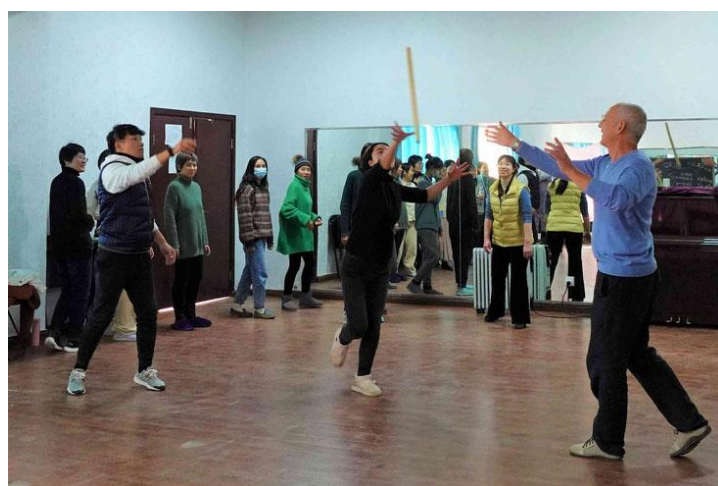
5. ábra: Játék dobófákkal (Pedroli 2022)

A Pár Play -gyakorlatok közül sok olyan tapasztalatot nyújt, ami elsőre lehetetlennek tűnik. Képzeljünk el egy gyakorlatot két emberrel. Az egyik áll egy botot a kezében, a másik előtte áll, háttal neki, majd lassan előre sétál. Egy bizonyos idő után az álló személy a botot a sétáló személy hátába dobja. Utóbbinak az a feladata, hogy észrevegye, amikor a botot hátulról dobják, megforduljon és elkapja a botot. Ebben a gyakorlatban felfedeztük, hogy pontosan meg lehet különböztetni, hogy a sétáló személy érzékeli-e, hogy a mögötte álló személy mikor dobja el ténylegesen a botot, vagy mikor kapja az impulzust a bot eldobására. A dobó és az elkapó közötti csere révén mind az elkapó felfedezheti saját észlelési- és reakciótevékenységét, mind pedig a dobó felfedezheti az impulzusai és a cselekedetei közötti megfelelés mértékét, és egyre pontosabban kezelheti azokat.