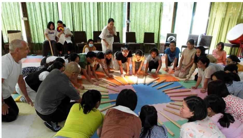
1. ábra: Játék dobófákkal (Pedroli 2022)

2023. márciusa és júliusa között 3 alkalommal volt lehetőségem részt venni intuitív pedagógiai workshopon Játék és intuíció néven a solymári Waldorf Pedagógiai Intézet szervezésében. Az első két alkalommal 1 egész napot töltöttünk együtt, harmadjára egy hétvégét, így összesen 4 teljes napot. A workshopon a testtel való „játék” került a fókuszba, amely során olyan intenzív kétoldalú gyakorlatok révén próbáltuk legyőzni a megszokott mozdulatokat, amelyek integrálják a test bal és jobb oldalát, a karokat és lábakat, a bal és jobb agyféltekét, a hangos és csendes, gyors és lassú mozgásokat. Az ilyen típusú gyakorlatok egyik velejárója az intenzív öröm érzése, amely lehetővé teszi, hogy legyőzzük a nehezen kezelhető blokkokat. Ezek a mozgásos játékok jellemzően csoportban zajlanak, a változatos gyakorlatokon keresztül magas fokon edzik az érzékszervek használatát.