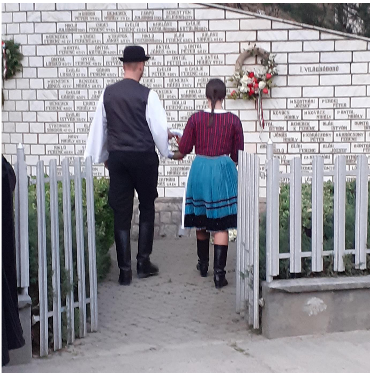
5. ábra: Emlékművet állítottak az 1919-es áldozatok tiszteletére.

Köröstárkányban a templom melletti téren az 1919-es áldozatok tiszteletére emlékművet avattak fel 1990. augusztus 15-én, ahol minden évben megemlékezéseket tartanak. 21 A lakosság közül néhányan nehezményezték az emlékmű felállítását, ezek az emberek a mélyinterjúk alkalmával elmondták, hogy ennek az oka a félelem. A félelem dominanciája mai napig is jelen van a településen, ennek ellenére minden évben istentisztelettel kötik össze az emlékmű megkoszorúzását, ahol a mai ifjú nemzedék ünnepi, magyar versekből és népdalokból összeállított műsorral nyilvánítja ki tiszteletét a múlt áldozatai előtt.