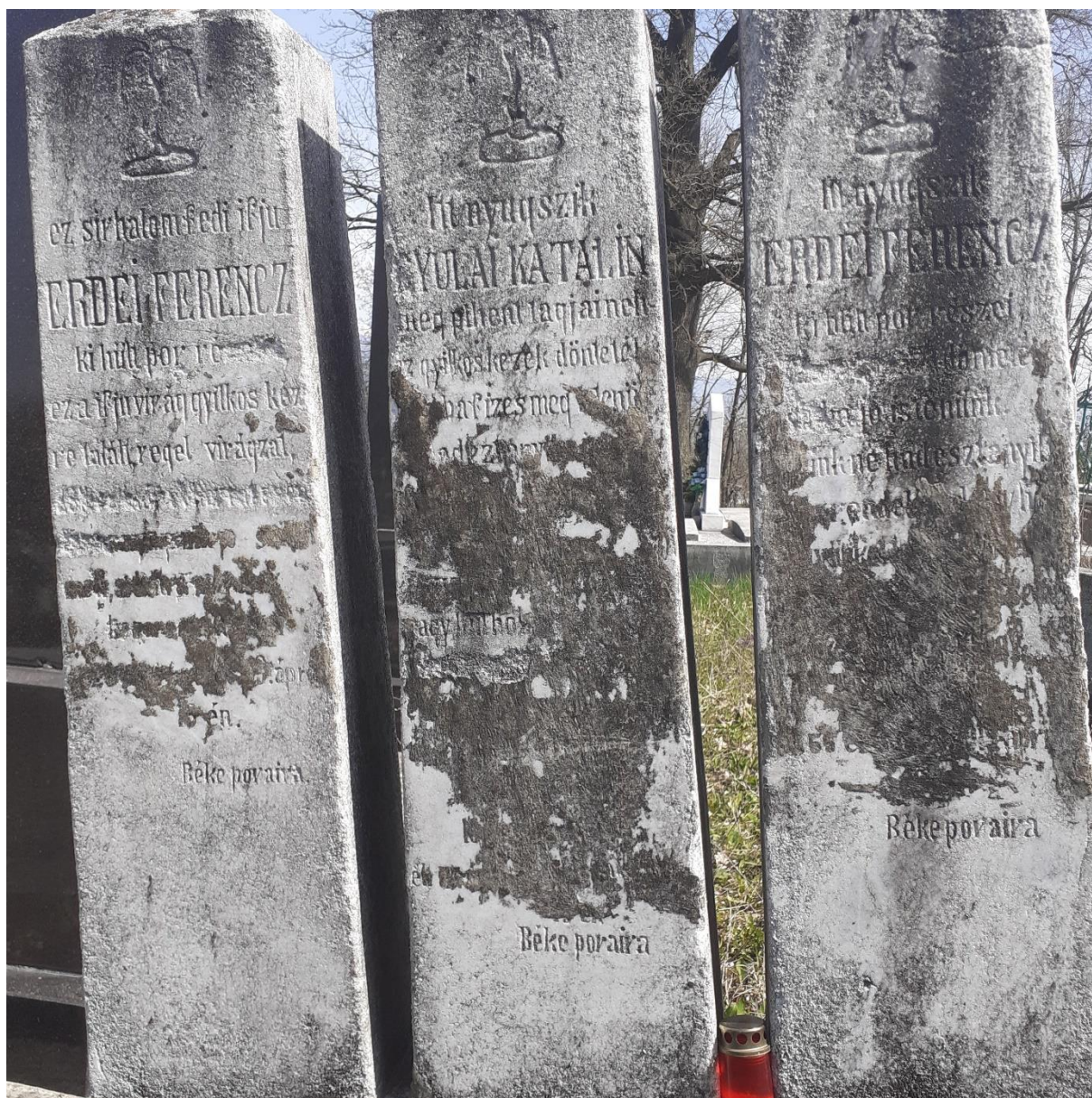
4. ábra: Letöröltették a fejfákon levő neveket és a halál dátumát

1945-ben Lorx Tibor aradi konzul jelentést tett Kállay Miklós külügyminiszternek címezve 20 , mely az egyetlen hivatalos jelentés ismereteim szerint.