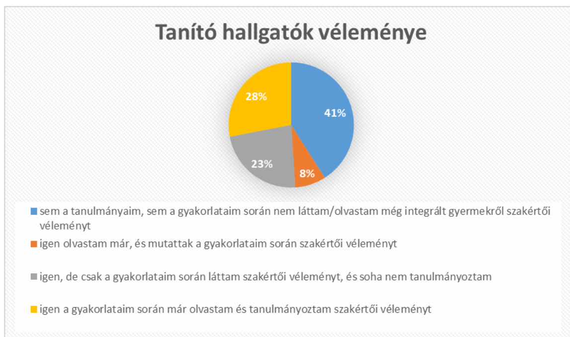
3.ábra Tanító hallgatók véleménye

A másik lényeges kérdésem a hallgatókhoz szólt, hogy mikor találkoznak először a szakértői véleményekkel. Olvasnak e a tanulmányaik során illetve tanulmányoznak e ilyen dokumentumokat a gyakorlati munka előtt. A megkérdezett hallgatók 41% azt állítja, hogy sem a gyakorlatok, sem a tanulmányok alatt nem találkozott és nem olvasott szakértői véleményt. Mindössze 28% az, aki olvasott és tanulmányozott, és ami még lényeges, hogy 23 % csak a gyakorlatban találkozott vele. Alap feladatként kellene a tanítási gyakorlatban megjelenni, hogy a szakértői véleményt megismerjük és tudjuk is alkalmazni. Hiszen ez a kiindulópont, első lépés, ami meghatározza, hogy milyen irányban induljunk el a tanítási folyamatban, olyan információkat adhat, ami nagyban segíti a pedagógiai munkát.