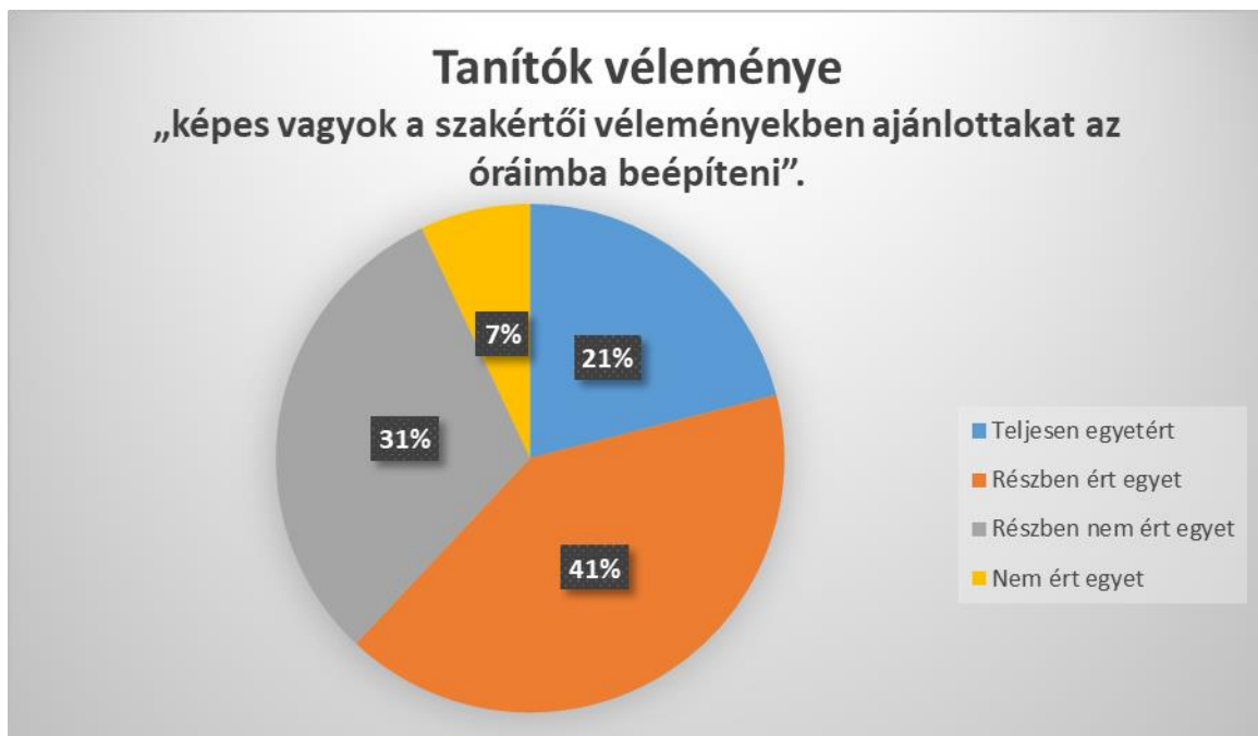
2.ábra Tanítók véleménye

A tanítók csupán 12% értett egyet, hogy képes beépíteni a szakértői véleményekben olvasottakat a pedagógiai gyakorlatban. 49% részben igen és 33% pedig részben nem értett ezzel egyet. Ami azt is jelenti, hogy a közel 200 megkérdezettből 12 % magabiztos a gyakorlati alkalmazásban.