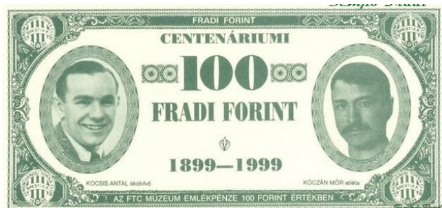
8. ábra: Kóczán Mór a centenáriumi emlékpénzen