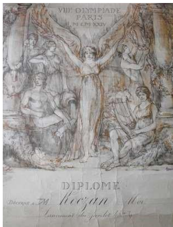
5. ábra: Kóczán Mór oklevele a párizsi olimpiáról