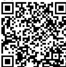
3. ábra: Az RPI hittan játék- és zenetár QR kódos elérhetősége

A katechéták 3-18 éves kor közötti korosztály számára, az hittankönyvcsaládhoz tartalmilag illeszkedő feladatokat találhatnak. Jelenleg 26 típus elérhető, melyben szöveges, képes ötletek éppen úgy fellelhetők, mint tárgyanimációs és kézműves feladatok is. A felhasználók száma, a feladatbankban található statisztikai adatok alapján ma 2000 fő, akik több mint 7000 (könyvű, nehéz és átlagos szintre bontott) feladatot érhetnek el. Ezekből a szolgáltatók, a saját csoportjukra szabott módon, differenciáltan állíthatnak össze feladatlapokat. Az elkészült anyagok kinyomtathatók és kézbe adhatók, vagy pdf formátumban (akár megoldókulccsal együtt) kiküldhetők. Bizonyos típusokhoz a katechéták maguk is írhatnak feladatokat. Mivel a hittankönyvek online olvasható változata az RPI honlapján megtalálható, valamint az általános iskolai hittankönyvek digitális tankönyvként is beépítésre kerültek már az elmúlt években, így ezekre támaszkodni lehetett. Ehhez nyújtott még segítséget a 2019-ben indult mobil és számítógépes applikáció is, az RPI hittan játék- és zenetára, ahol hittanórai énekek, játék ötletek elérhetők. (Elérhetősége: https://rpi-jatekok.reformatus.hu/#/home )