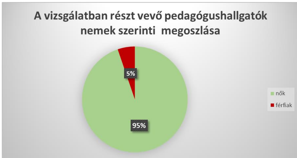
I. ábra: A vizsgálatban részt vevő hallgatók százalékos megoszlása nemek szerint

A vizsgálat a 2019/2020-as akadémiai év téli szemeszterében valósult meg, az első félév végén, pontosan a szemeszter záró írásbeli dolgozatot követően. 8 A vizsgálatban az Óvodai és elemi pedagógia tanulmányi program első éves, nappali tagozaton tanuló hallgatói vettek részt. A felmérést összesen 76 hallgató abszolválta. Ez az akadémiai év kezdetén evidált hallgatók létszámától eltér, mivel az év kezdetén a tantárgyra összesen 86 hallgató jelentkezett fel, de a téli szemeszter szorgalmi időszakának 13 hete 10 hallgatónyi lemorzsolódást eredményezett. A vizsgálati minta és végleges összetétele tehát a következő: 76 nappali tagozatos óvodapedagógus hallgató (ebből 72 első éves és 4 másodéves hallgató, ez utóbbiak a tantárgyat az előző évből ismételték). A hallgatók nemek szerinti létszáma: 72 nő és 4 férfi.