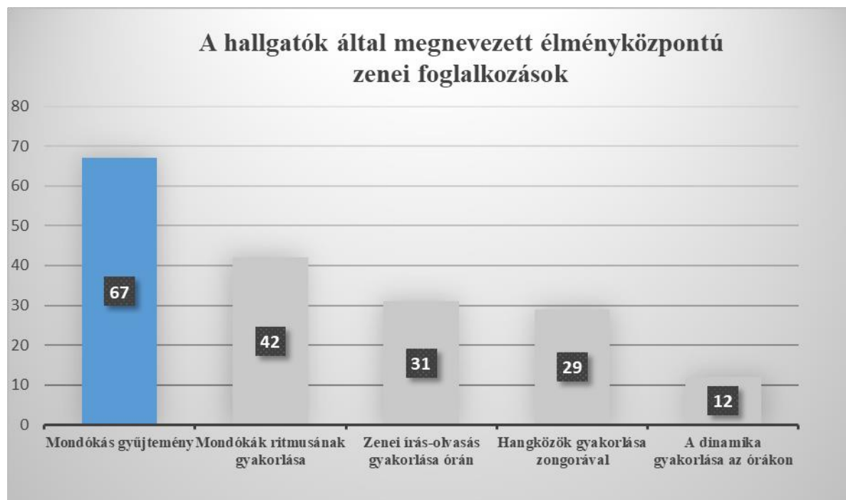
3. ábra: A hallgatók által megnevezett élményközpontú, és a tanulást segítő zenei foglalkozások a számadatok tükrében

Ezek a foglalkozások kvantitatív szempontból pontos adatokkal kimutathatók.